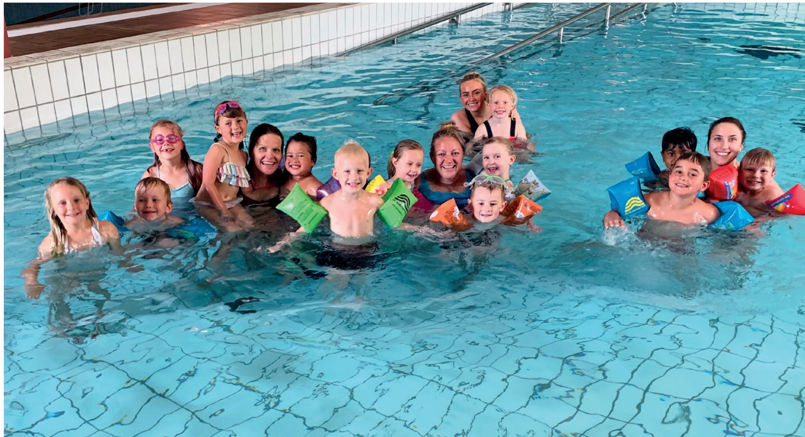
BASSENG: For barna i Maurtuva er symjing vekas høgdepunkt. Denne veka har heile gjengen på Tusenbein hatt avslutning i Gullbring.

Dei resterande barnehagane i Midt-Telemark har ikkje svart på Bø blads førespurnad om dei har søkt eller bruka tilskotet frå Statsforvaltaren.