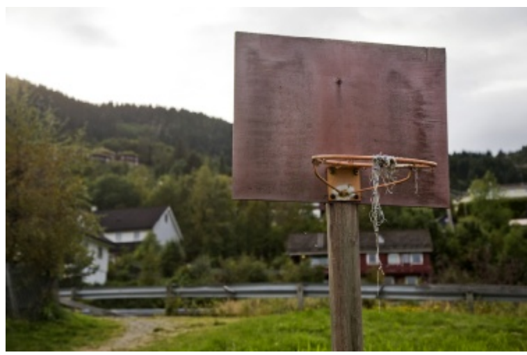
SKULESTADVEGEN: Basketkorga har sett betre dagar.