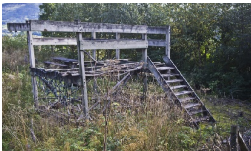
SEIMSFELTET: Attgrodd klatrestativ.