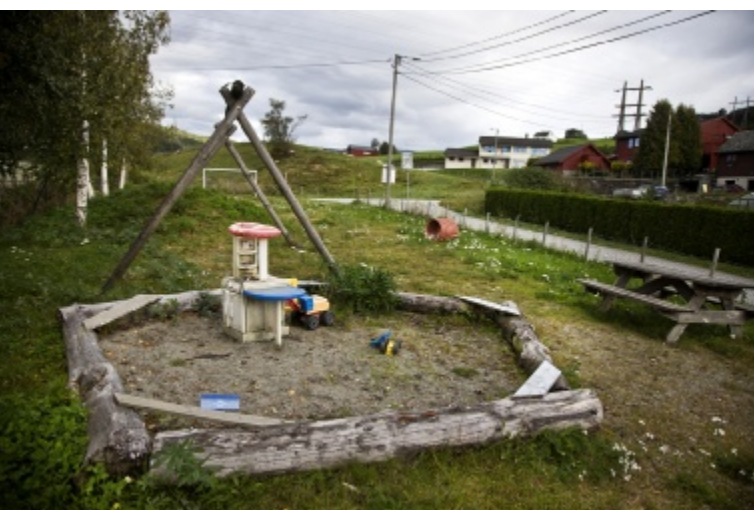
VETLEFLATEN: Huskestativ utan husker.