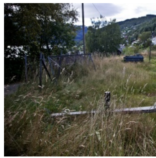
ULLESTADVEGEN: Humpedissa forsvinn i grase