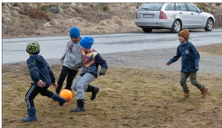
FOTBALL: Myanmar-guttene har mange venner i Andøy. På bildet har de besøk av to, og da er det naturlig å ty til fotballen som de har mye glede av sammen.

– Det er vel og bra at kommunen og omstillingsorganisasjonen Samskap har fokus på å få utflyttet ungdom til å flytte hjem, og å få nye til å flytte til kommunen, men det er svært viktig å ha