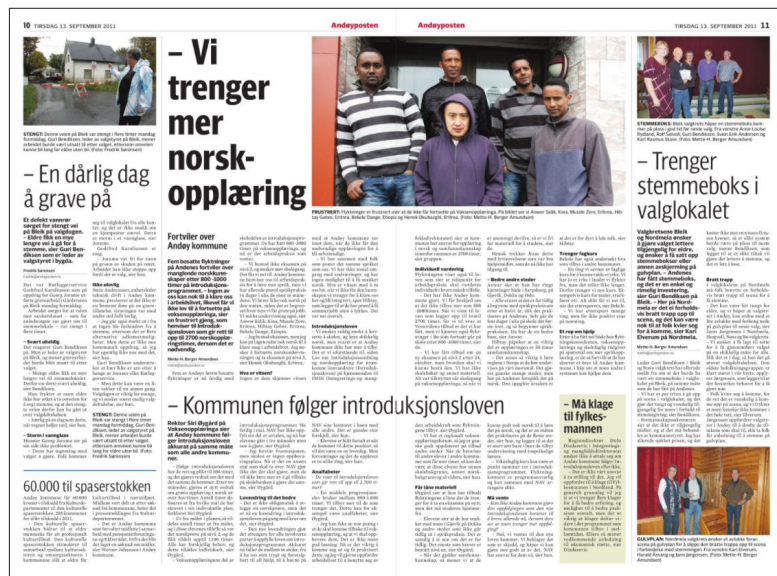
OPPVÅKNINGEN: Andøypostens søkelys på «opprøret» til fem bosatte flyktninger, som reagerte på at de ikke fikk nok norskopplæring til å klare seg i arbeidslivet etter introduksjonsprogrammet, førte til en sakte oppvåkning blant lokale byråkrater og politikere.