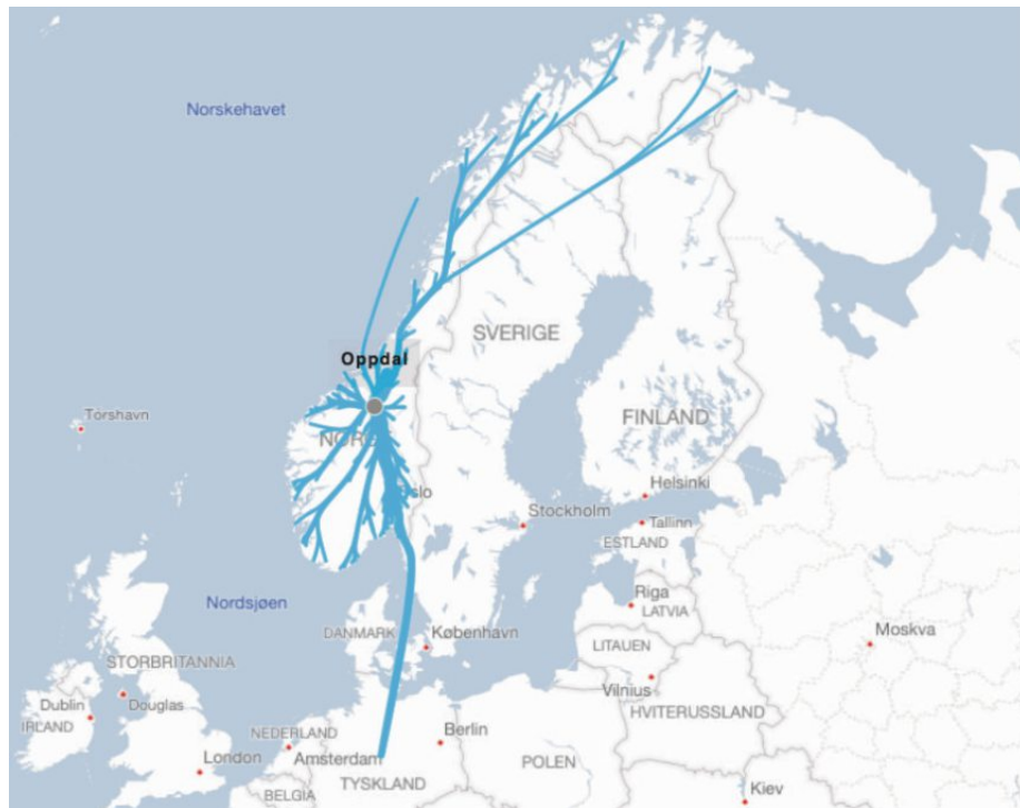
Flyttestrømmen fra Oppdal: Oppdaling har de siste 20 årene spredt seg utover landet. Flest har dratt til Trondheim, og Oslo, mens Utlandet har trukket til seg 307 oppdaling mellom 2000- og 2019. 222 har flyttet til Rennebu, og 88 til Melhus. 73 oppdaling har flyttet til Sunndal.