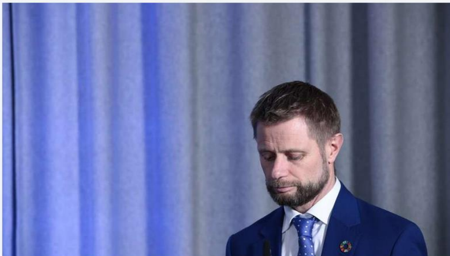
Den daglige pressekonferansen i forbindelse med koronasituasjonen. Helse- og omsorgsminister Bent Høie (H).

Helseminister Bent Høie (H) sier til NTB at Norge nå har en større buffer med smittevernutstyr enn før, og at det akkurat nå ikke er akutt mangel på noe.